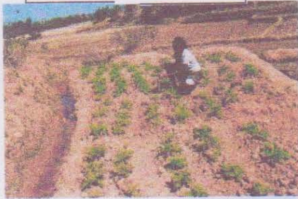
Manampy à Ankazondrano