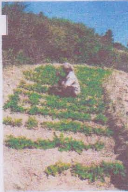
Soandrina à An-tsaha