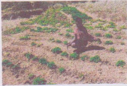
Seraphine à Ankazondrano