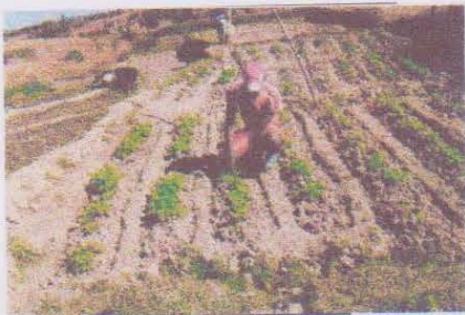
Manga à Sahamila