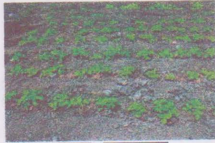
Mena à An-tsaha