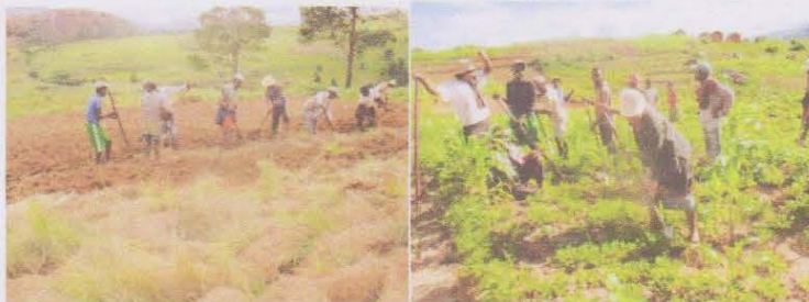
Création de composts pour la fertilisation de la terre et formation