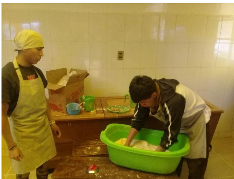
Compra de víveres secos, y los chicos semanalmente preparan el pan para consumo.