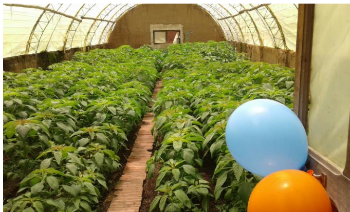
Cuando baja el tiempo de heladas, hacemos la siembra de patata y en carpas de esto es amaranto.