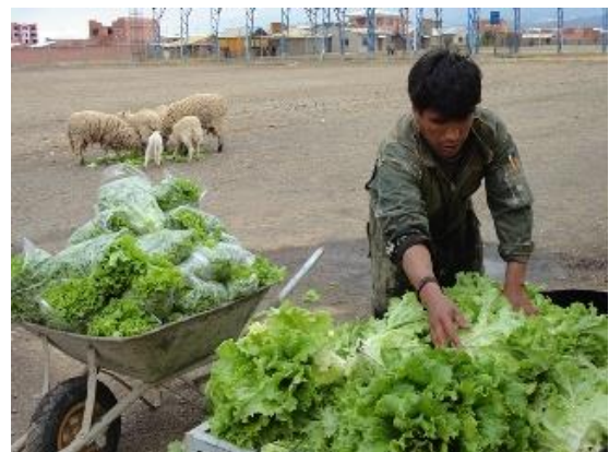
Productos de coles y lechugas cosecha de las carpas solares.