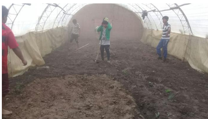
Parte de la terapia de los usuarios es el cuidado de animales y plantas, y desde allí tomar conciencia del cuidado de la vida